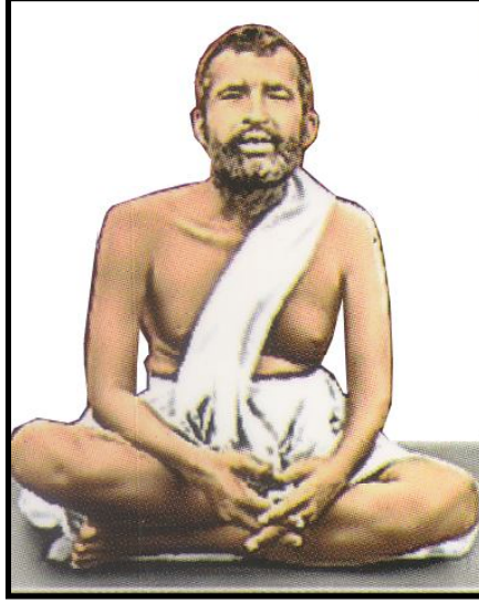
பகவான் ஸ்ரீ ராமகிருஷ்ணர்